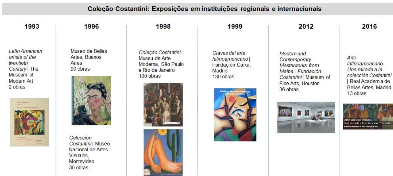
Gráfico 1 – Evolução da Coleção Costantini desde o final dos anos 1970 até 2016.